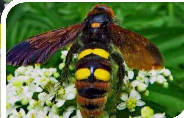
Сколия - гигантская